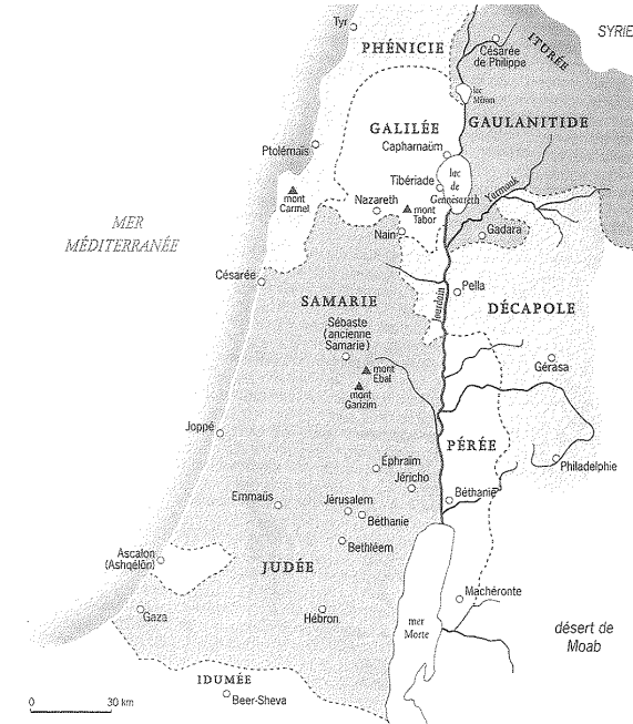
La Palestine au temps de Jésus